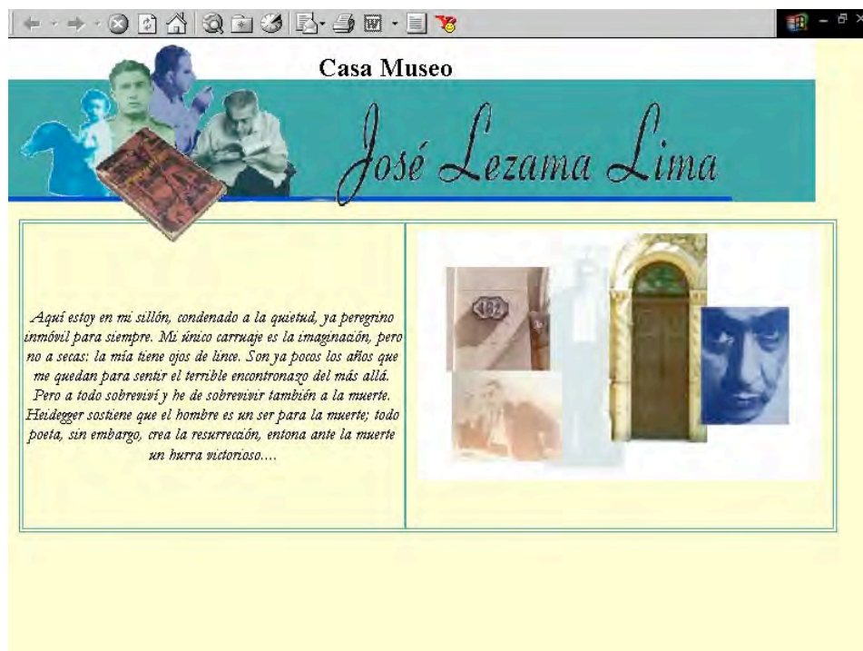
Musée Lezama Lima. http://www.cnpc.cult.cu

cette manière le musée virtuel offre la possibilité d'accéder à l'information qu'on ne peut pas trouver dans la salle de musée, sauf qu'il s'agit d'une visite spécialisée ou qu'on pose la question au professionnel du musée. Dans le musée virtuel de Regla, par exemple, on peut trouver information sur l'histoire de la région où est situé le musée, et aussi information sur les religions d'origine africaine et ses divinités. De cette manière, on offre information culturelle, connaissance générale que peut augmenter le bagage culturel du lecteur-navigateur et aussi attirer son attention et réussir qu'il puisse devenir visiteur du musée.