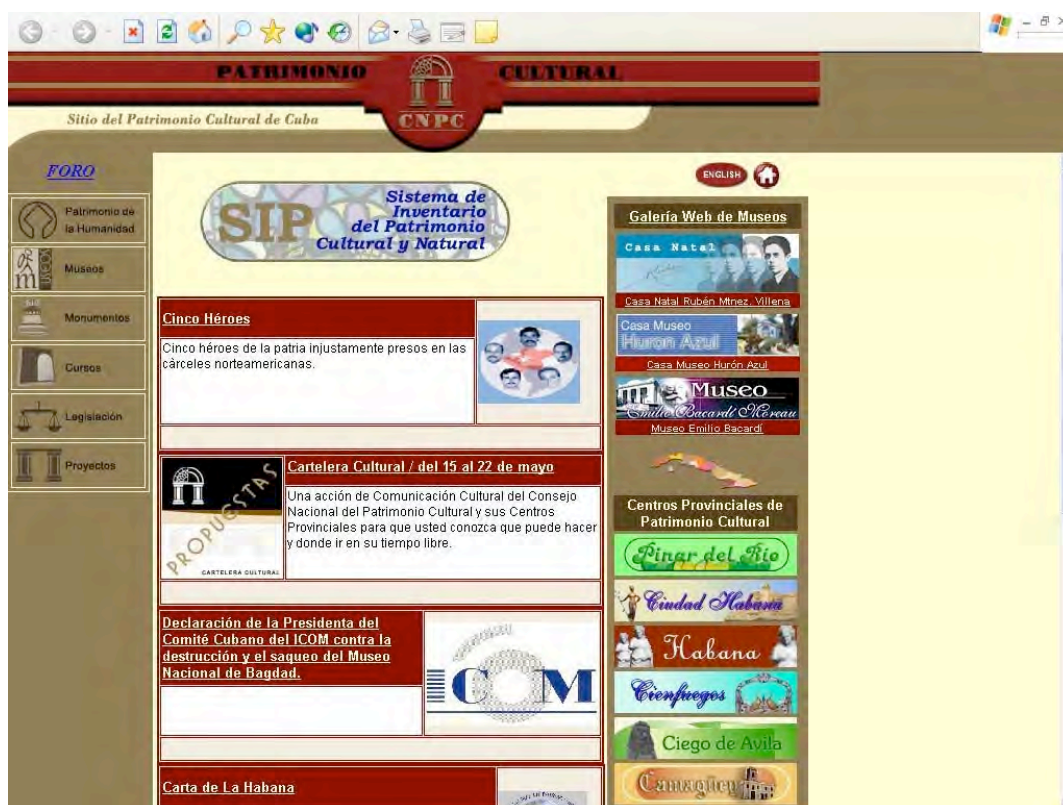
Page inicial du site du patrimoine culturel cubaine. http://www.cnpc.cult.cu