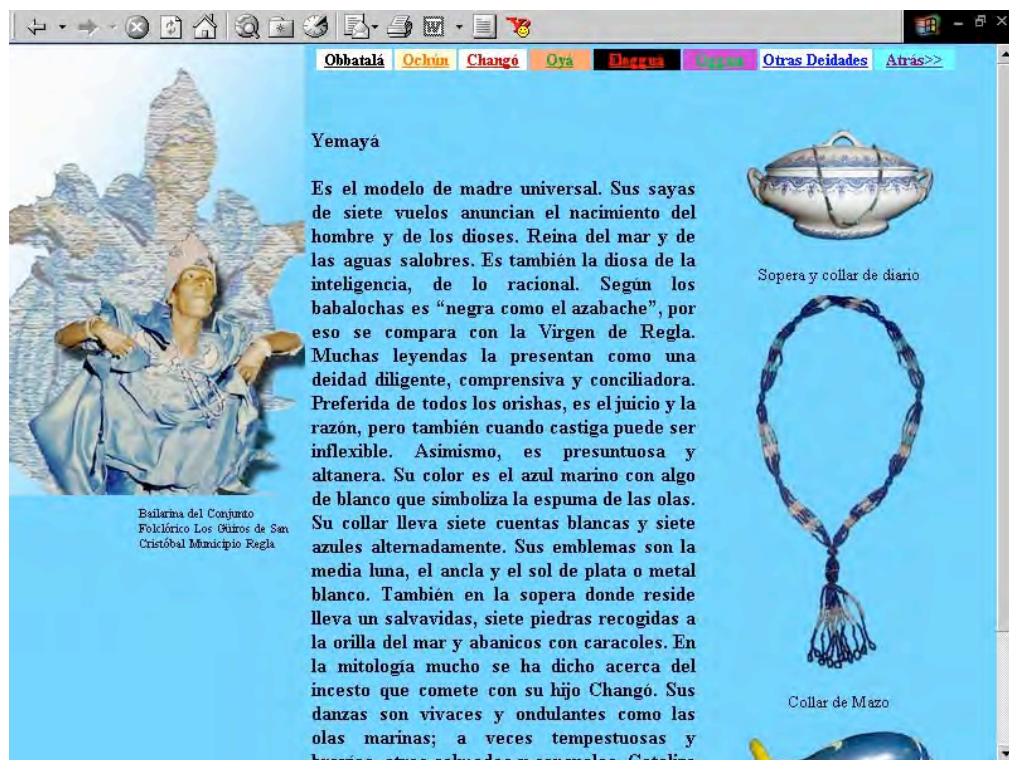
Pièces du Musée de Regla appartenant au Regla de Ocha.

un musée fermé pour être rénové et modernisé, approcher un site culturel ou naturel donc l'accès est difficile à cause de la situation géographique, réfléchir sur les transformations faites, enrichir, attirer, dupliquer, divulguer. Dans notre cas, par exemple, le Musée Municipal de Regla, un musée général possédant une collection ethnologique religieuse importante et qui se trouve dans un quartier riche en traditions culturelles, il était en train de restaurer et changer son dessin muséologique au moment de commencer son reproduction virtuelle, raison pour laquelle la collection ont été organisée à partir de l'expression religieuse représentée et pas du tout à partir de les salles d'exposition.